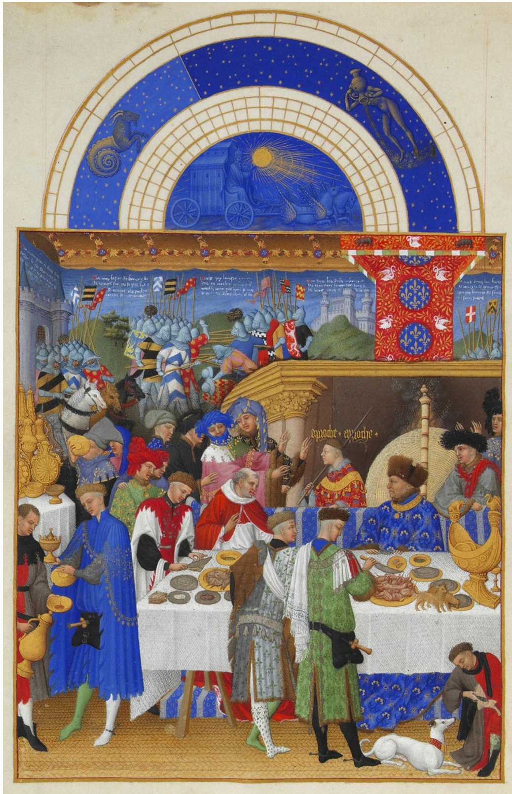
Wikipedia: Très riches heures du Duc DeBerry